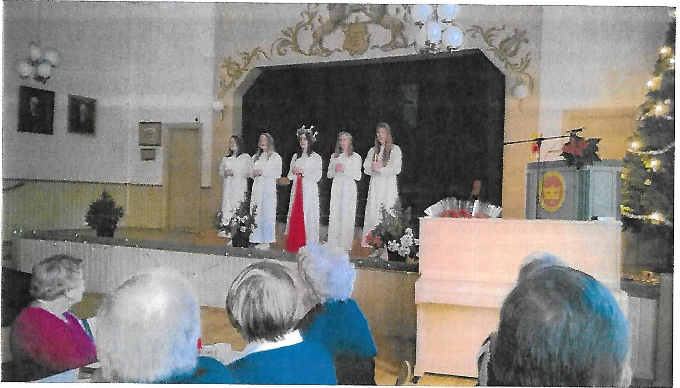
Julfesten besöktes av Kronoby Lucia med tärnor.