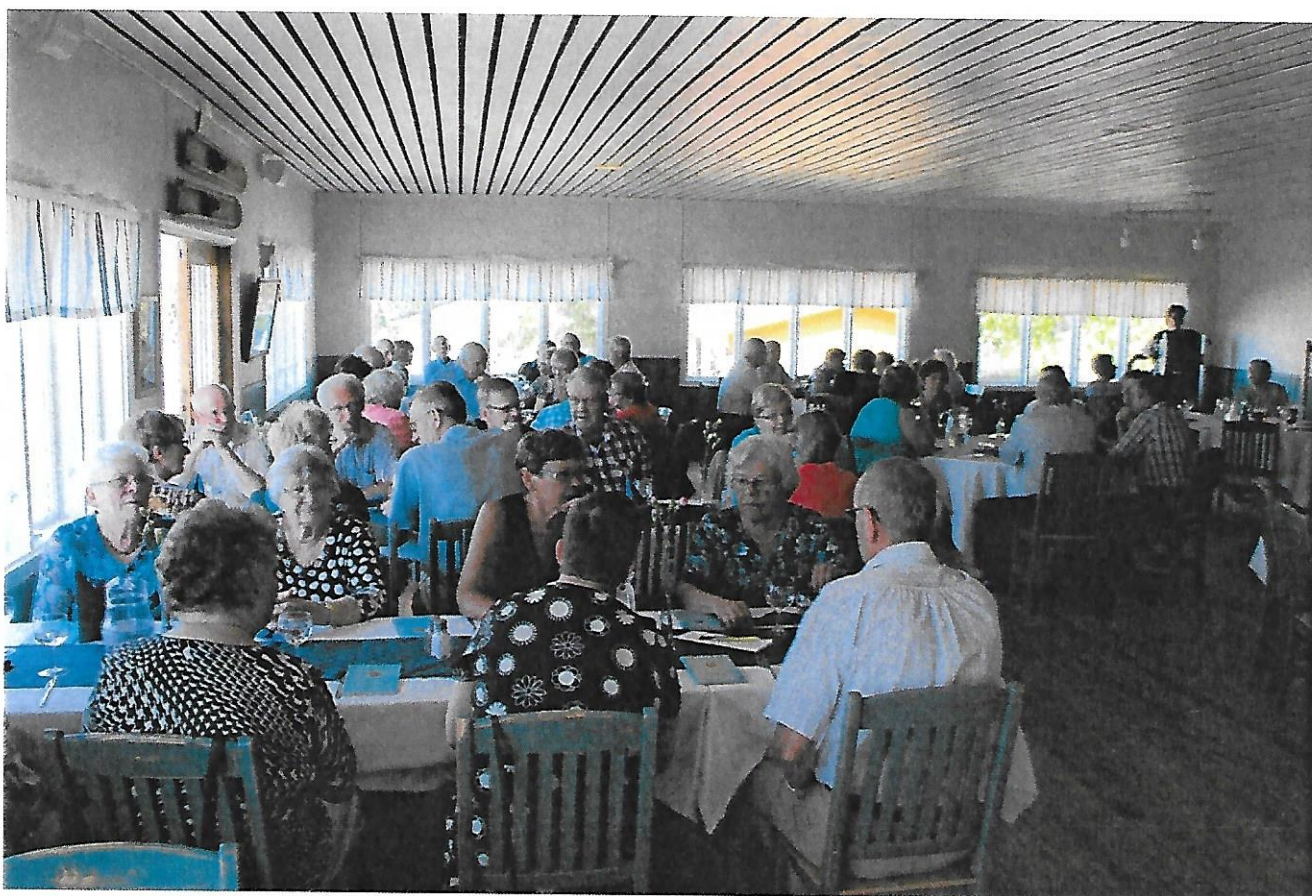
Vårsåsongen avslutades på Hästöskatan och var välbesökt.