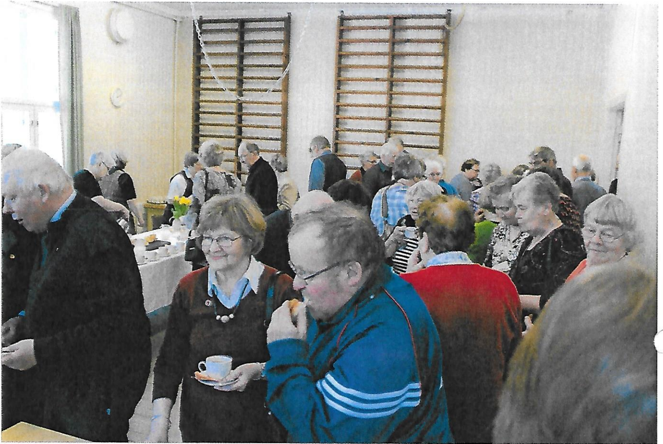
Kaffepaus på aprilmötet i Hopsala byagård.