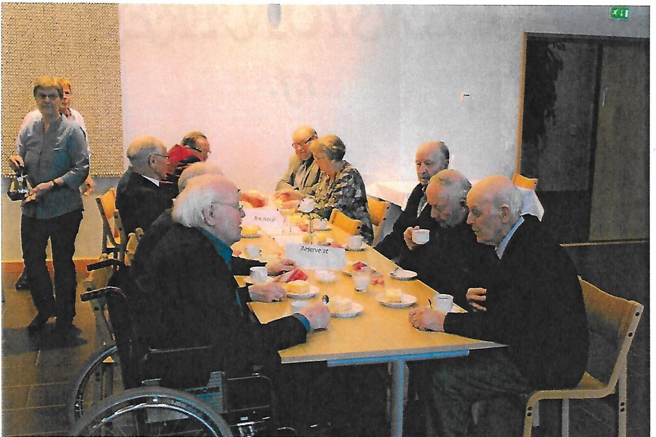
Veterankören uppträdde på minnesmötet i januari och avnjuter kaffe efteråt.