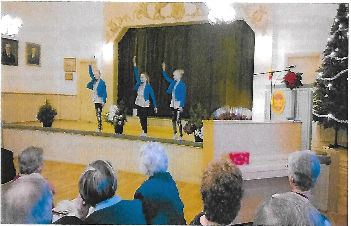
Poppisarna uppträder på julfesten.